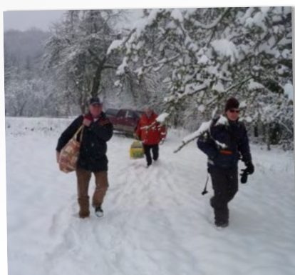
OP PAD MET GOED GEVULDE BOODSCHAPPENTASSEN