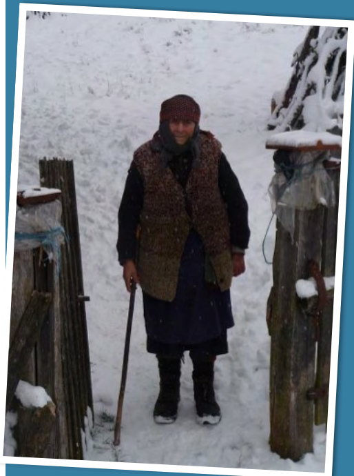
zo worden we uitgezwaaid

Een oudje van 72 heeft een speciale band met de postbode. Hij moet altijd wat bij haar blijven drinken. Ze is heel eenzaam en pakt bezoek met beide handen aan. Luidkeels riep zij: "Mama Mia", toen ze ons zag aankomen baggeren door de dikke sneeuw. Onze broeken waren drijfnat. We werden schoon gepoetst en kregen gebreide sokken aan. Te pas en te onpas riep ze "Mama Mia". We kregen thee, koffie of een schnaps. Heel gastvrij ging ze van alles regelen. Ze heeft een zoon wonen in Italië en een zoon in Arizona. Van haar zoon in Arizona had ze met kerst 20 euro gekregen. Tja, wat moet je daarvan denken. Zij heeft wel stroom in haar huisje aan de rivier. Ze woont op zo'n idyllische plek. Waanzinnig mooi.