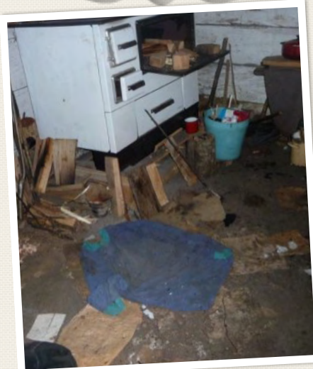
We komen niets halen