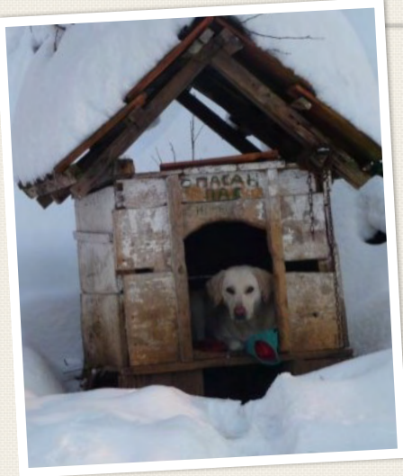
ik heb een hondkomen