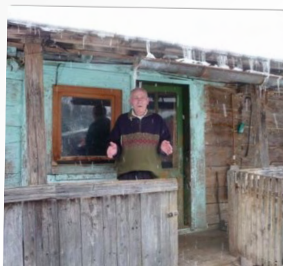
WAT MOET IK ZONDER JULLIE HULP