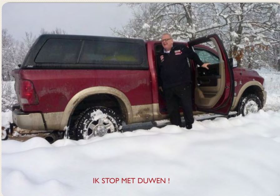
IK STOP MET DUWEN !