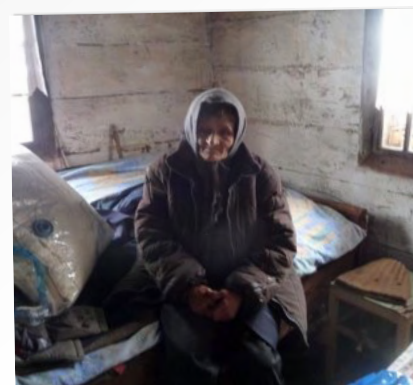
82 JR. ZONDER WATER EN ELEKTRA IN EEN HUTJE IN HET BOS