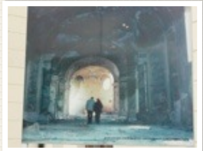
KERK INTERIEUR TOEN