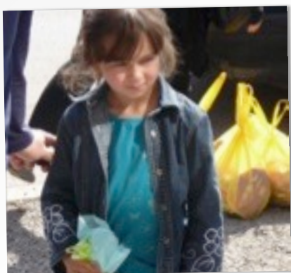
SLECHT ZIEN WEL GENIETEN

rivier die tevens grens is. Door de herlocaties van Serven, Bosniërs en Kroaten zijn er hele groepen mensen die nu buiten de boot vallen qua werk en dus inkomen. Deze "vluchtelingen" komen niet in aanmerking voor een gelijke vorm van sociale hulp zoals de lokale bevolking krijgt en de stichting de Drie Engelen vult dit gat zo goed mogelijk. De religieuze basis is het aspect waarbij hulp aan de medemens voorop staat en je elkaar helpt.