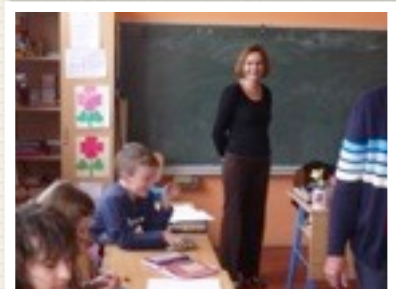
KADOOTJES DAT KLIKT !