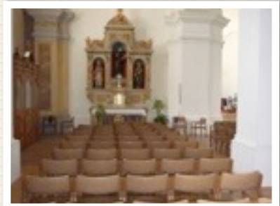
EN DAN HET HEDEN