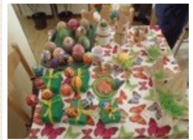
ZE DOEN HET GRAAG