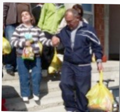
MET PA WEER NAAR HUIS