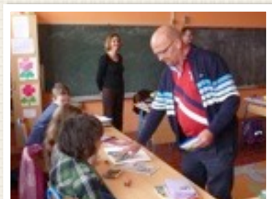
PETE ZEER SERIEUS BEZIG