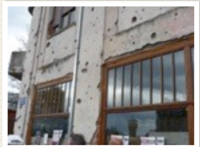
Littekens nog niet weg